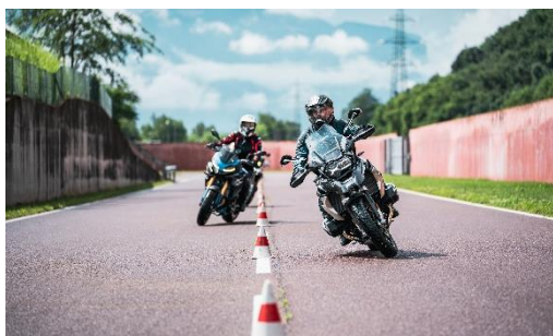
Foto 3: Centro di guida specializzato per corsi professionali e test dei vari modelli