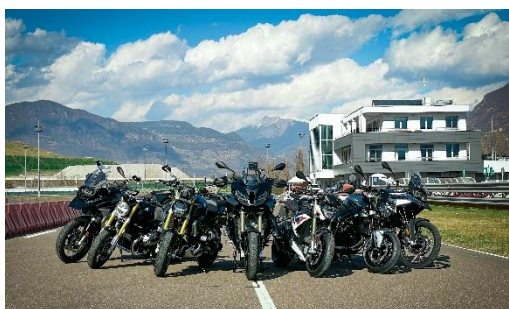
Foto 1: BMW Motorrad Test-Center Alto Adige e la sua flotta. Dal 2024 anche la nuova R1300 GS