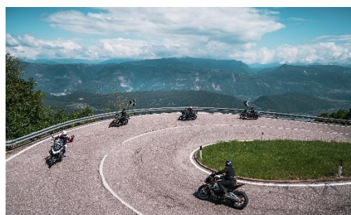
Foto 4: Accesso diretto alle Dolomiti per tour spettacolari