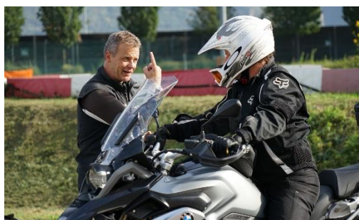
Foto 2: Feedback individuale e corso professionale con istruttori certificati BMW