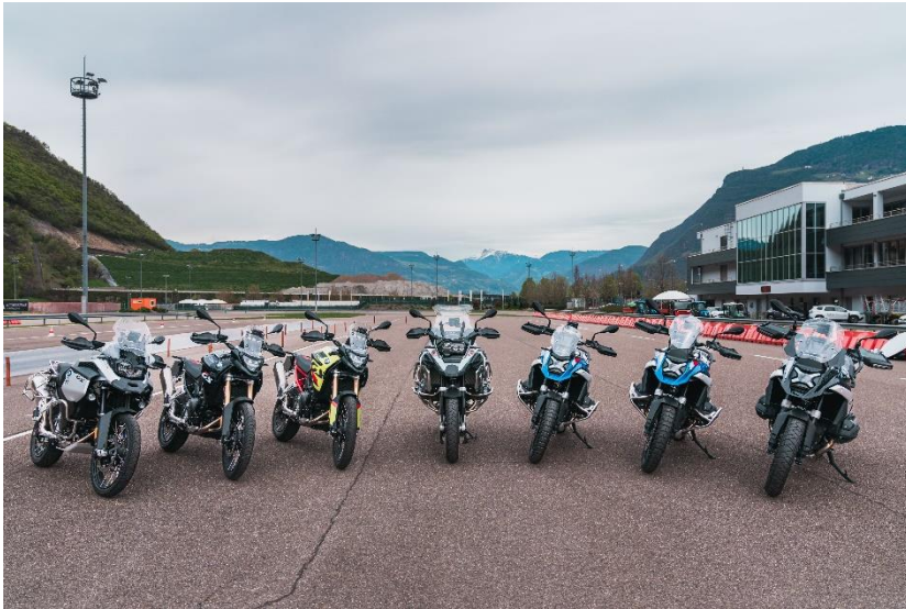
Abbildung 1: BMW Motorrad Test-Center Südtirol mit Motorradflotte. Ab der Saison 2024 mit brandneuen Modellen wie der R 1300 GS.