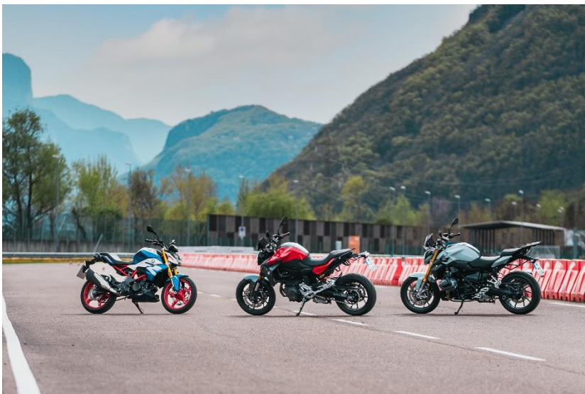
Abbildung 2: Mit 20 Motorrädern bietet der Fuhrpark von Riding Experience Südtirol eine vielfältige Auswahl, die für Testrides, Trainings und Touren sowie zur Vermietung zur Verfügung stehen.